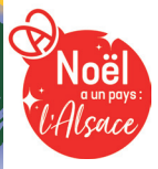
ILLUSTRATION : IZHAK.FR

40 CHAETS ★ CONCERTS EXCEPTIONNELS ★ NOMBREUSES ANIMATIONS ★